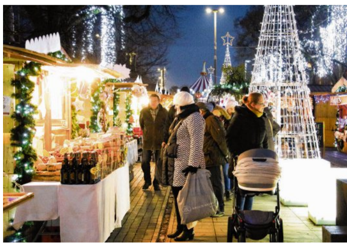
Der Stettiner Weihnachtsmarkt erstreckt sich über mehrere Straßen und Plätze in der Innenstadt der Odermetropole.

anderem in der Blumenallee, auf den Plätzen Adamowicza und Lotników sowie in der Fußgängerzone Bogusława zu finden sein. Wer speziell auf der Suche nach einem Weihnachtsgeschenk „Made in Szczecin“ ist, könnte auch bei der Weihnachtsmesse „Slow XMas“ am 11. Dezember von 12 bis 18 Uhr in der