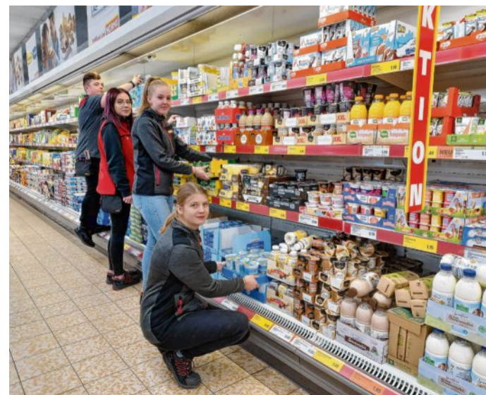
Auch mal gemeinsam anpacken - das ist ein Schwerpunkt bei der Azubi-Woche im Anklamer Norma.

Kontakt zur Autorin a.maass@nordkurier.de